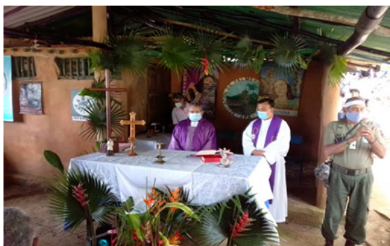
Eucaristía realizada en el rancho de los Palmeros. Semana Santa

Al comienzo de cada año, se fija el cronograma de actividades de los Palmeros Asuntinos. Aparte de organizar la celebración tradicional de la bajada de la Palma Bendita, se planifican estadías en el campamento de los Palmeros en el Parque Nacional Cerro el Copey, con la finalidad de realizar jornadas de mantenimiento y excursiones con los Palmeritos. Próximo al mes de febrero se convoca a la primera asamblea general de Palmeros, la cual es dirigida por el presidente o algún miembro de la directiva, luego se van realizando otras reuniones antes de la Semana Santa. Allí se informa lo relacionado con los permisos a INPARQUES y lo concerniente al apoyo institucional (Gobernación y Alcaldías).