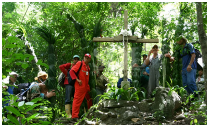
Viacrucis realizado por los Palmeros. Semana Santa