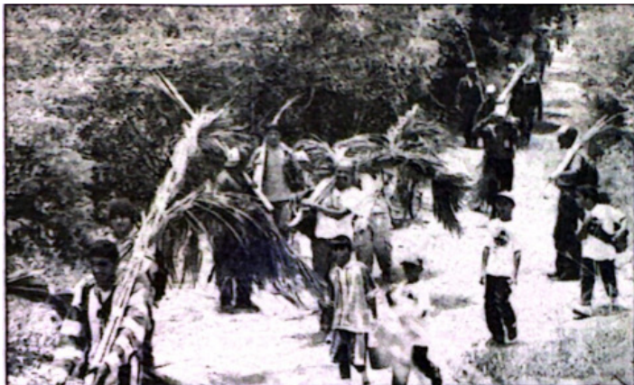
Palmeros Asuntinos bajando el Cerro El Copey.

Huertas, en el conjunto residencial Micaela, en el Municipio Arismendi del estado Nueva Esparta.